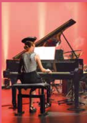
Spectacle de fin d'année.