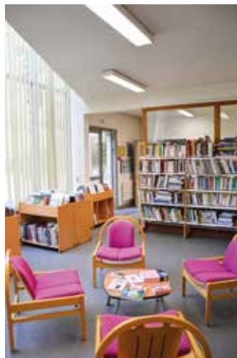
Un réaménagement de l'espace adulte plus convivial