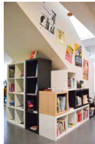
Un espace dédié aux 14-20 ans !