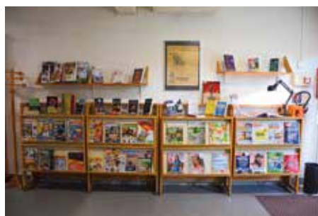
Un nouvel espace d'accueil avec les périodiques et les nouveautés