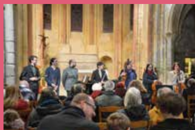
Spectacle des professeurs à l'Église Saint Étienne.