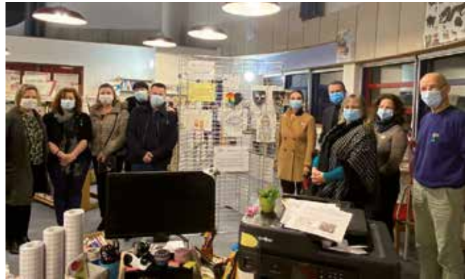
Journée Nationale contre le Harcèlement, jeudi 5 novembre

Parmi les actions, l'Aapems travaille activement pour la lutte contre le harcèlement scolaire, fléau qui peut démarrer dès les plus petites classes. La sensibilisation permet notamment de délier les langues et de ne pas en faire un sujet tabou. C'est pourquoi nous avons souhaité, comme l'année dernière, être acteur lors de la journée nationale contre le harcèlement qui s'est tenue le jeudi 5 novembre, et ce en partenariat avec le collège. Malheureusement un mouvement de grève très suivi au niveau des enseignants nous a contraints de décaler cette journée au jeudi 26 novembre. Malgré ce report, nous avons pu organiser un concours de créations artistiques autour de cette thématique. Les élèves de tous les niveaux ont pu laisser libre cours à leur imagination. Les créations rendues nous ont vraiment épatés, touchés et impressionnés par tous les messages que les élèves