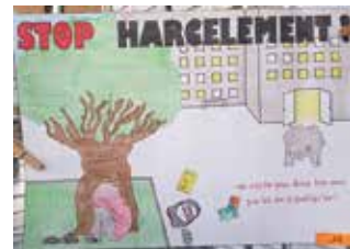
1 ère Meilleure création des 5 ème : Ethan