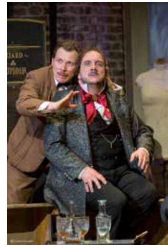
Le Cercle de Whitechapel