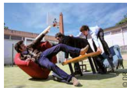
Compagnie La Mob à Sisyphé

(École Municipale de Musique) / Église Saint Etienne