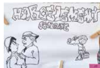
1 ère Meilleure création des 4 ème : Robin