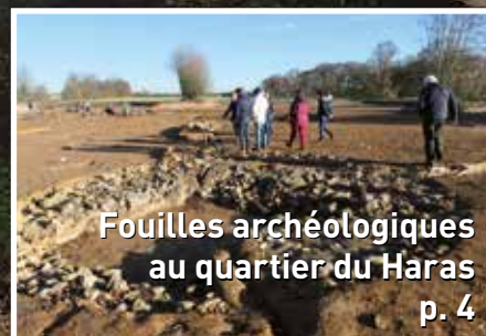
Fouilles archéologiques au quartier du Haras p. 4

Bonne année 2021 à tous les Marlysiens !