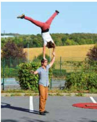
Primo : Festival des Arts de Rue

➤ Dimanche 13 septembre - Primo : Festival des Arts de Rue organisé par Le Moulin Fondu, en partenariat avec la CARPF. Du rire et du cirque proposés par les compagnies Petit Monsieur et Maximum Quartet.