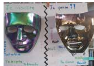
1 ère Meilleure création des 3 ème : Maxime