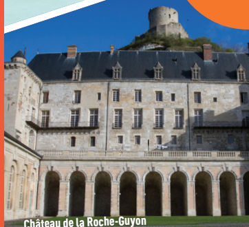
Château de la Roche-Guyon