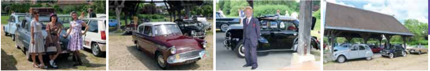
Le 25 juin dernier , le parc Allende a accueilli, le défilé « auto rétro » pour leur 8 ème édition.