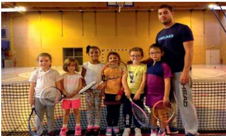
Mais honneur aux petites « mesdames » qui ont ouvert la saison !