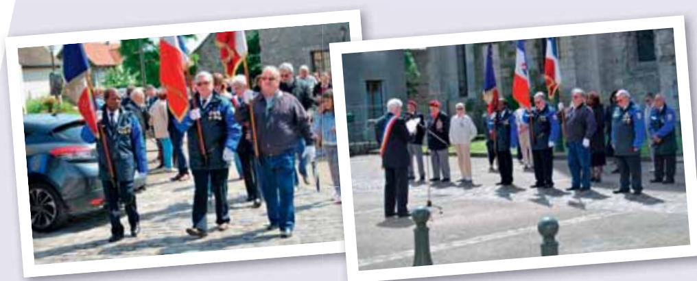
Cérémonie du 14 juillet 2016