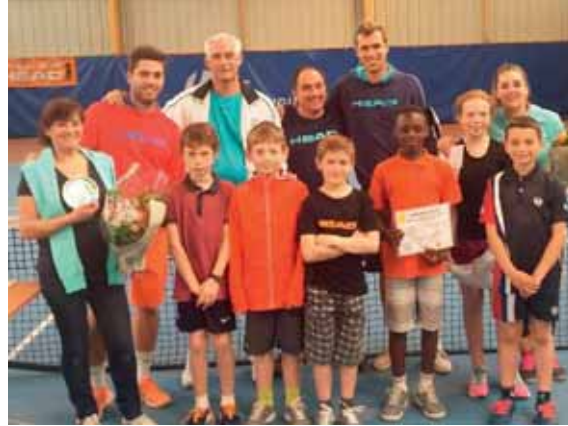
Finalistes Dames, Messieurs, Jeunes et en Doubles mixtes