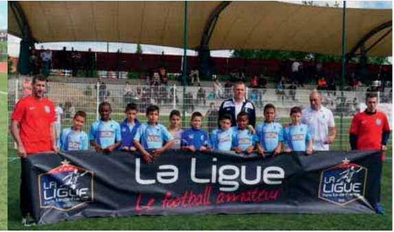
EQUIPE U11 FINALISTE DEPARTEMENTAL DU CHALLENGE U11