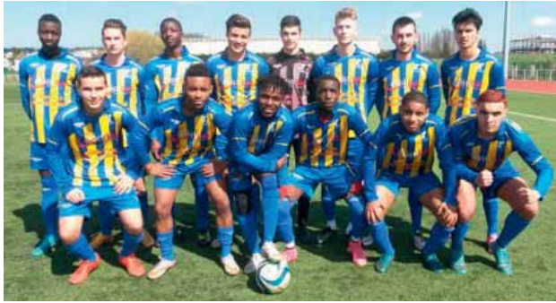
EQUIPE U19 CHAMPIONNE DU VAL D'OISE 2015 / 2016