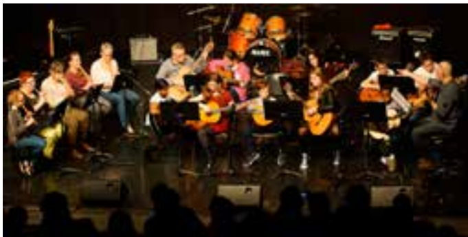
Le 25 mars dernier, le compositeur français Erik Satie, né il y a tout juste 150 ans à Honfleur, était à l'honneur par ce groupe musical.