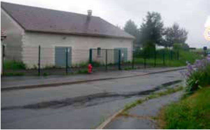
« Suppression » Hameau de la Sucrierie La station Lucien Jean