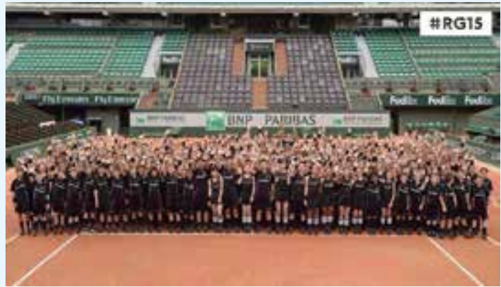
Le groupe des 250 ramasseurs... heureux.