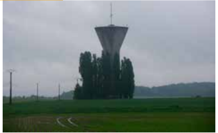
Le Château d'eau de Marly la Ville