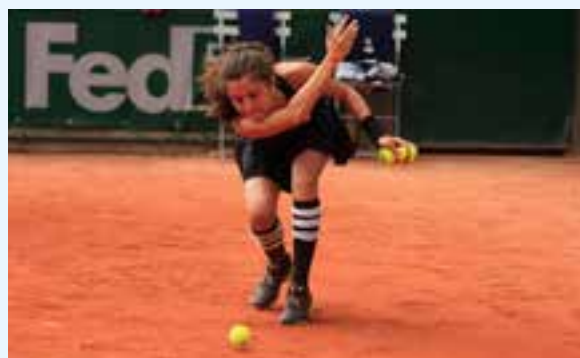
Le geste le plus important du ramasseur : le Rouler pour transmettre les balles à ses comparses.

« Alors si vous êtes partant n'hésitez pas, participez aux sélections! ».